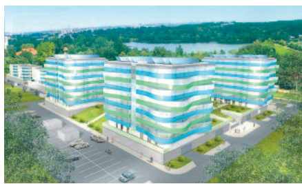
Rekreacyjna Dolina – Duży Staw – koncepcja zespołu mieszkaniowego

„Rekreacyjna Dolina Mały Staw” malowniczo położone w sąsiedztwie Katowickiego Parku Letniego. Inwestycja obejmująca cztery na wskroś nowoczesne nie tylko pod względem wizualnym, ale również technicznym, trzypiętrowe budynki o łącznej liczbie 128 mieszkań wraz z garażami z podziemnymi miejscami postojowymi – jest to I etap inwestycji. Opracowana już została także kompleksowa dokumentacja projektowo-kosztorysowa dla II etapu teże inwestycji zakładająca budowę czterech budynków sześciopiętrowych łącznie o 120 mieszkańach z lokalami użytkowymi. Obydwa projekty – oprócz atrakcyjnej lokalizacji inwestycji – wyróżniają się ciekawą nieszablonową architekturą nawiązującą stylizacją elewacji do „fal na stawie”.